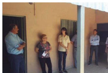
Club de Abuelos.