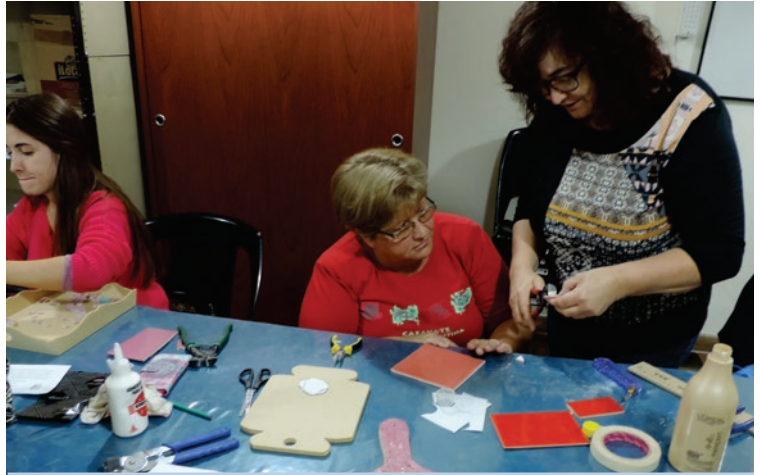
45 propuestas educativas ofrece este 2018 la escuela comunal.

En este sistema 2018 habrá, para destacar, 212 horas semanales de educación y con hasta trece jornadas en un mismo día y como siempre el compromiso desde la Comuna de Franck de llevar adelante otro año más con 1103 alumnos de las 45 propuestas educativas fortaleciendo y demostrando que nuestra localidad es nuevamente referente en toda la región con este sistema educativo social.