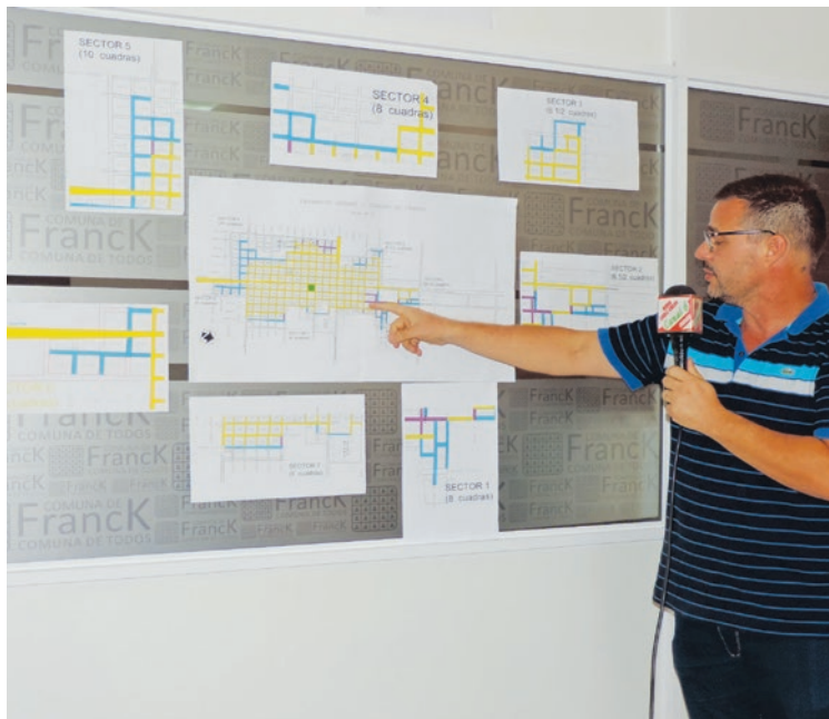
El Plan de Pavimento N° 7 comprende 55 cuadras a pavimentar.