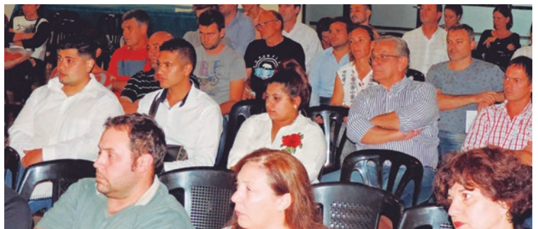
Empresarios, emprendedores y público en general asistió a la charla.