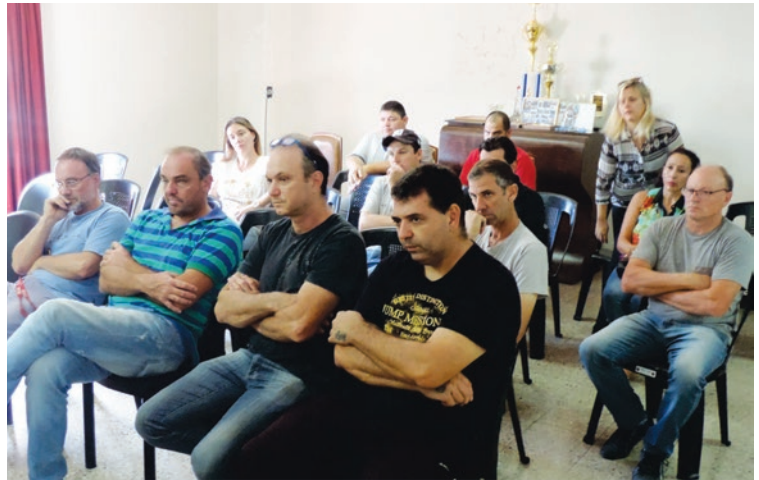
Las Pymes de Franck asistieron a una reunión en la Comuna.

Los expositores expresaron su voluntad de generar vínculos entre las partes a fin de promover las condiciones necesarias que permitan encauzar los distintos proyectos de las Pymes, siendo que éstas constituyen un engranaje muy importante en la economía de la localidad. Desde la Comuna de Franck se continuará generando en