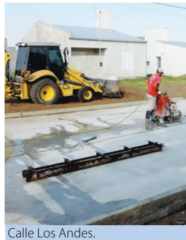
Calle Los Andes.