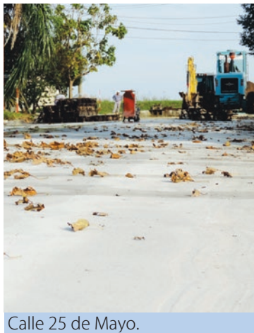
Calle 25 de Mayo.

Se asfaltaron las calles Rivadavia entre las de H. Irigoyen; Los Andes entre las de E. López y 9 de Julio; 25 de Mayo entre las de Av. Berizzo y A. Albrecht, y Belgrano entre Adolfo Albrecht y Juan XXIII.