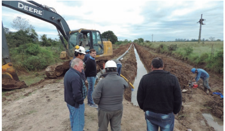
El refuerzo del gasoducto permitirá incorporar nuevos usuarios.

Se comenzaron con los trabajos correspondientes al refuerzo de gasoducto. Los mismos se realizan en el predio ubicado en zona rural de San Jerónimo del Sauce donde se procedió a limpiar el lugar y a construir las bases, plateas y cerco perimetral donde se instalará la válvula para continuar luego con la extensión de los 800 mts de cañería que conforman el refuerzo y que serán soterrados. Además, se trabaja junto con la Cooperativa de Provisión, Obras y Servicios Públicos,