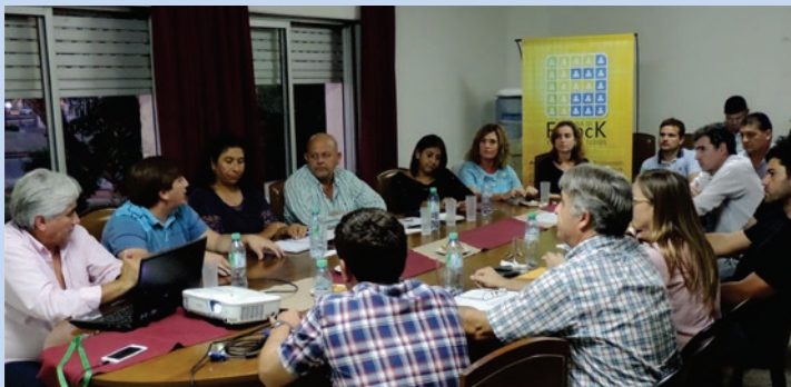
Sobre 4 ejes está trabajando el Área Metropolitana de Santa Fe.

• Qué hacer en las grandes áreas vacantes que hay en la zona, como predios militares o terrenos ferroviarios en desuso. Se proyecta sobre posibles usos industriales y de logística, viviendas y equipamientos metropolitanos, por ejemplo para plantas de tratamiento