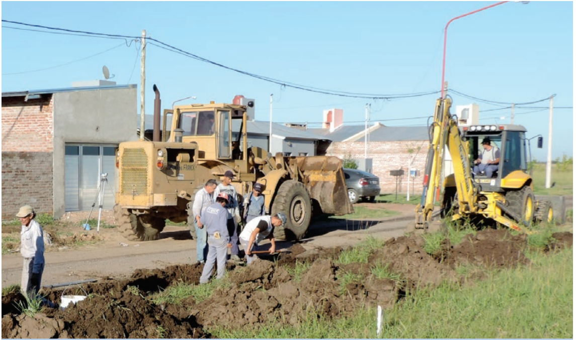
La Comuna avanza con obras de cordón cuneta en los lotes destinados al programa "Mi Tierra Mi Casa".

La Comuna continúa con las obras de infraestructura en los lotes destinados al programa provincial de acceso a lote propio denominado "Mi Tierra Mi Casa". En esta ocasión se avanza con la construcción de cordón cuneta sumándose a las realizadas en este lugar como apertura de caminos, tendido eléctrico y extensión de red de agua potable que realiza la Cooperativa de Provisión de Obras y Servicios Públicos Sociales y Asistenciales y Vivienda de Franck Limitada.