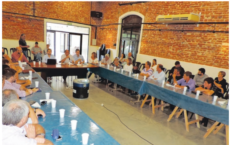
Franck fue sede recientemente de dos de los encuentros del ECAM.

Se encuentra trabajando el Ente de Coordinación del Área Metropolitana (ECAM), entidad que agrupa a 22 localidades de la región, entre las que se encuentra Franck. El ente aborda las potencialidades y problemáticas comunes de la región que comprende el Área Metropolitana, abarcando desde cuestiones de riesgo hídrico, residuos, uso de suelo, conectividad, producción e industria, entre otros matices, con el fin de avanzar en proyectos concretos desde los equipos técnicos. Tuvieron lugar dos reuniones en Franck del ECAM. En la primera, el Secretario Pro-