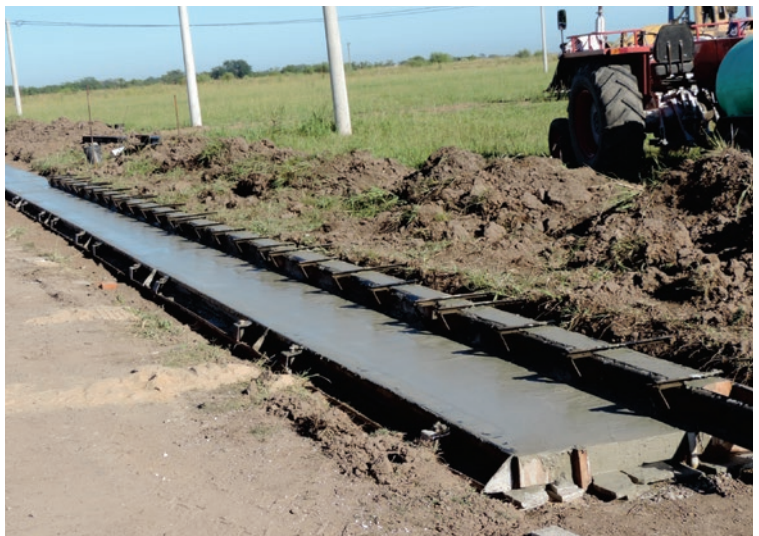
El cordón cuneta se suma a otras obras de infraestructura ya realizadas.

La Comuna continúa con las obras de infraestructura en los lotes destinados al programa provincial de acceso a lote propio denominado "Mi Tierra Mi Casa". En esta ocasión se avanza con la construcción de cordón cuneta sumándose a las realizadas en este lugar como apertura de caminos, tendido eléctrico y extensión de red de agua potable que realiza la Cooperativa de Provisión de Obras y Servicios Públicos Sociales y Asistenciales y Vivienda de Franck Limitada.