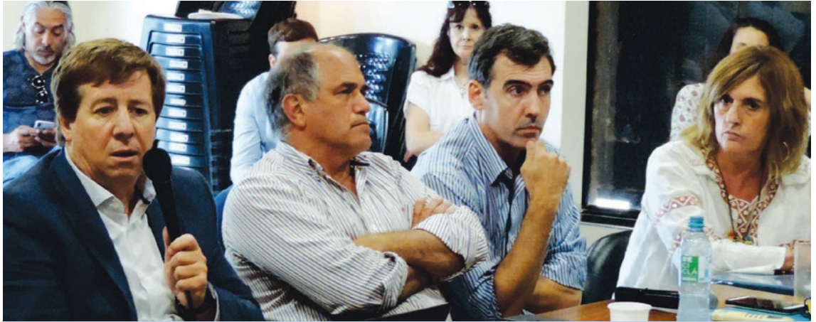
Autoridades provinciales y municipales trabajan para abordar problemáticas que afectan a la región.

Se encuentra trabajando el Ente de Coordinación del Área Metropolitana (ECAM), entidad que agrupa a 22 localidades de la región, entre las que se encuentra Franck. El ente aborda las potencialidades y problemáticas comunes de la región que comprende el Área Metropolitana, abarcando desde cuestiones de riesgo hídrico, residuos, uso de suelo, conectividad, producción e industria, entre otros matices, con el fin de avanzar en proyectos concretos desde los equipos técnicos. Tuvieron lugar dos reuniones en Franck del ECAM. En la primera, el Secretario Pro-