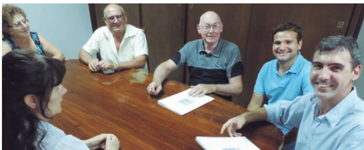
La Fraternal y Centro de Jubilados.

ron aportes a la parroquia local para pintura del exterior del edificio y a la Biblioteca Mariano Moreno.