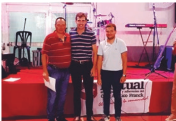
Club Atlético Franck.

A través de gestiones y ayuda económica se trabaja para el crecimiento de las instituciones locales. Tal fue el caso de los aportes realizados a Asoc. La Fraternal y Centro de Jubilados para la reparación de las fachadas de sus edificios institucionales; al CAF para su subcomisión de fútbol, al Cycles Moto Club para la construcción de sanitarios; al Club de Abuelos para la compra de pisos a utilizar en la ampliación del salón institucional. Además, se entrega-