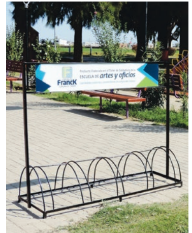
Nuevos biciclateros en la Ciclovía, el Centro Cultural y la Comuna.