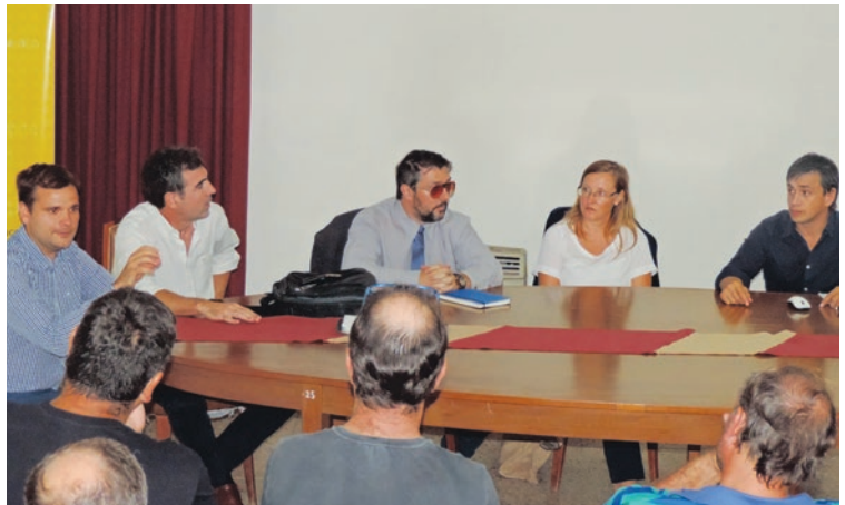
Se presentaron programas provinciales y crediticios para las Pymes.

conjuntamente con el Centro de Industria y Comercio de Franck, estos ámbitos de encuentro con el sector productivo para poner en conocimiento los distintos pro-