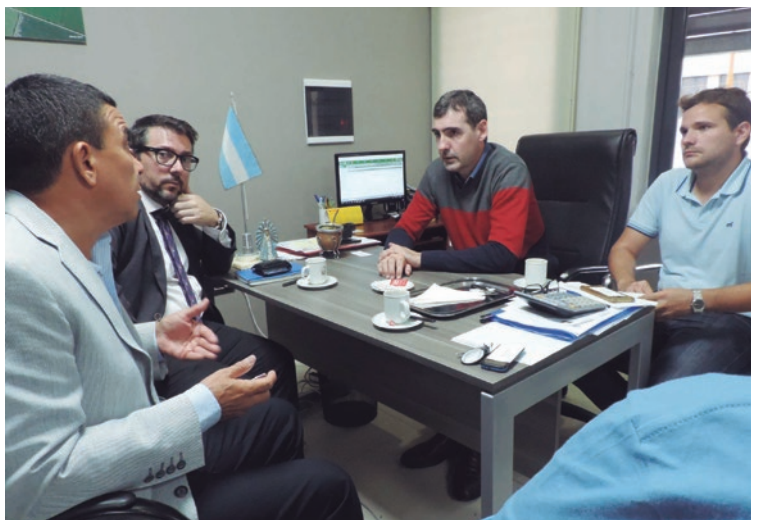
Autoridades comunales recibieron a directivos del banco.

El banco Nación abrirá sus puertas en Franck. En este sentido, la Comuna recibió a directivos de la entidad quienes expusieron los fundamentos para la radiación en Franck, destacando el gran crecimiento tanto poblacional como económico de la localidad, motivado por la gran industria, la potencialidad y entendimientos del sector Pyme; como así también la ubicación estratégica de la localidad, enmarcándose como punto referencial en la región.