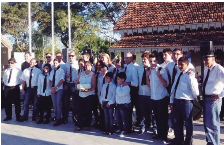
“Idea Colectiva” contó con la actuación de la Banda Comunal.

Los franckinos disfrutaron del programa de la Dirección de Cultura, Educación y Deporte denominado “Idea Colectiva”. El evento contó con la actuación de la Banda Comunal, quién además celebró su séptimo año de vida, y la participación de La Rhumbera. Además, hubo juegos para los más chicos y la exposición de artesanos locales que también hicieron de esta actividad una verdadera manera de compartir y disfrutar de los espacios públicos.