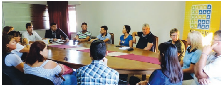
Funcionarios comunales recibieron a establecimientos educativos.

munales hicieron un balance de los aportes que brinda la Comuna en materia de educación, con el objetivo de colaborar y seguir apostando fuerte a la formación de las personas.